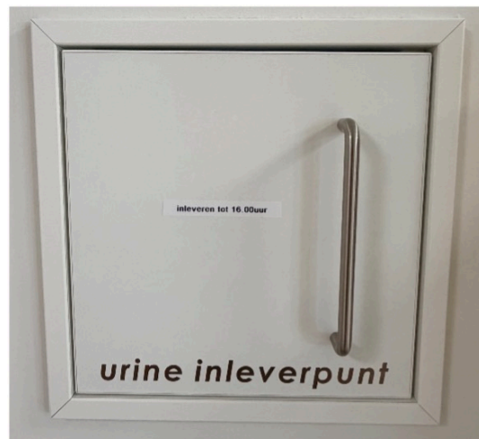
Urine-afgifte luik (inleveren tot 16.00u)