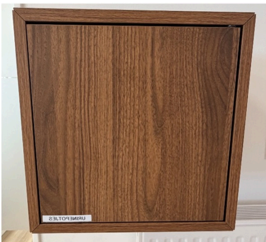
Urine-kastje (ophalen potjes)

Let op, ná 16.00u mag er geen urine potje meer afgegeven worden via het urine-afgifteluik