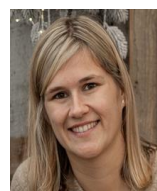
A. Blom (1-3-2025)

Heeft u eerder toestemming gegeven voor het uitwisselen van medische gegevens via het LSP? Dan blijft deze toestemming ook geldig in onze praktijk! Meer info: www.volgjezorg.nl